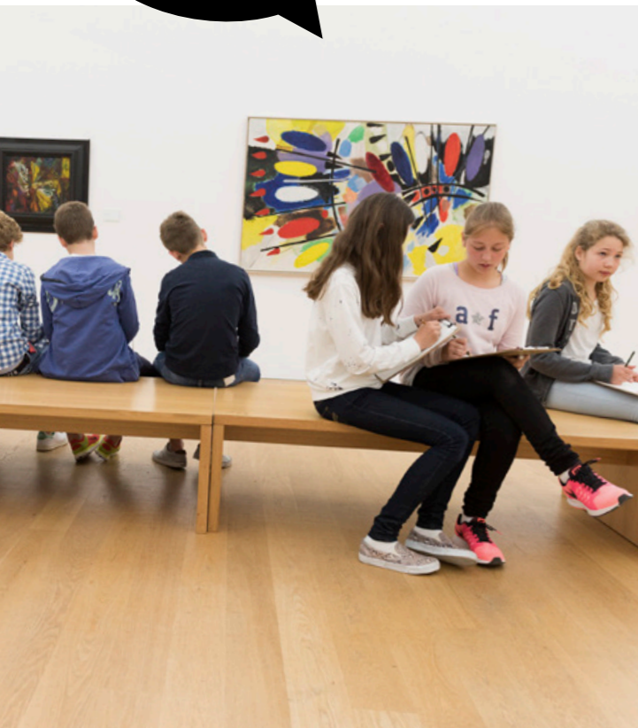
In der Klassischen Moderne

Schulklassen haben bei uns kostenlosen Eintritt in die Daueraus- stellungen.