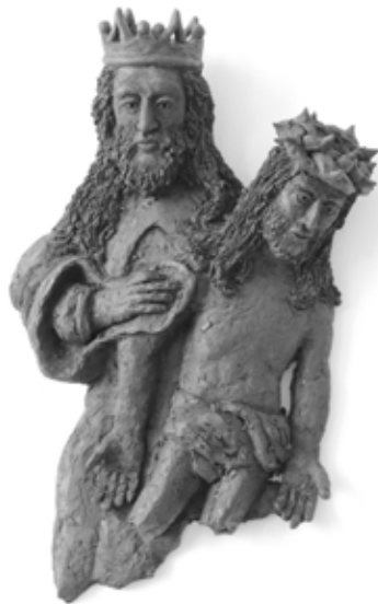
Jan Thomas, Ohne Titel, 2019, Foto: Jan Thomas

Die Installation von Jan Thomas im Kirchensaal besteht aus einer Vielzahl von keramischen Plastiken aus schwarz gebranntem, unglasiertem Ton. Die Intervention referiert in einzelnen Arbeiten direkt auf die Holzskulpturen des Mittelalters im Kirchensaal. Chimärenhafte Fledermauswesen knüpfen an Assoziationsräume der Nacht sowie an Grottesken des Mittelalters an, deren Bestimmung in der Abwehr des Bösen bestand. Die Gestalt der sozial hoch entwickelten und spezialisierten Fledermäuse in der vielfigurigen Wandinstallation changiert zwischen bedrohlichen Blutsaugern, Schreckfiguren, Heilsbringern und überaus realistischen Spezies. Versatzstücke aus unterschiedlichen Zeitebenen. Alltagskultur, und Science Fiction bilden für den Betrachter die Möglichkeit, neue Plots und Assoziationsketten zu imaginieren und an der eigenen Lebenswirklichkeit anzuknüpfen.