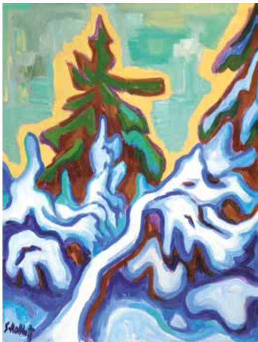
Karl Schmidt-Rottluff, Tannen im Schnee, 1951, Museum Wiesbaden, Stiftung W. und M. Rick 2013.

Die Kunstsammlungen präsentieren Glanzstücke der modernen und zeitgenössischen Kunst, der klassischen Moderne und der Alten Meister. Das Herzstück bildet die weltweit bedeutendste Sammlung des Werkes Alexej von Jawlenskys, das immer in unterschiedlichen Facetten präsent ist. Vom deutschen Expressionismus bis zur europäischen, russischen und amerikanischen Kunst nach 1950 finden sich Werke der großen Künstler neben Neu- oder Wiederentdeckungen.