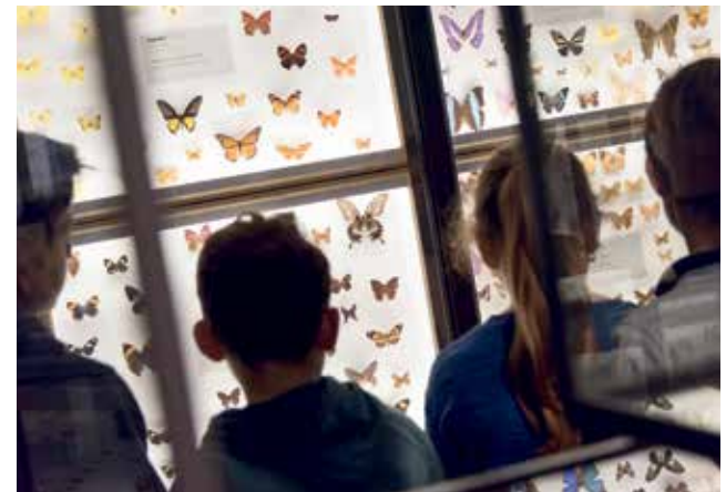
Farbenprächige Schmetterlinge

Tiere und Pflanzen aus nächster Nähe und in aller Ruhe wahrzunehmen, dazu lädt die Dauerausstellung der Naturhistorischen Sammlungen ein. Ein Eisbär in voller Größe, hunderte von farbenprächtigen Schmetterlingen, das winzige Nest eines Kolibris, die mächtigen Zähne eines Elefanten, ein Gepard im vollen Lauf – diese und mehr als 6000 weitere Naturobjekte aller Kontinente und aus vergangenen Erdzeitaltern stehen zum Staunen und Studieren bereit. Die Ausstellung bietet für alle Altersklassen und die ganze Familie spannende Entdeckungen. Während junge Besucher in einer Vitrine nach einem gut getarnten Rehkitz suchen, können sich Erwachsene zum Beispiel über 120 Pigmente und Farbstoffe informieren. Für Schulklassen und andere Gruppen gibt es ein breites thematisches Führungsangebot und für alle stehen in den vier Themenräumen der Ausstellung Zeichenbretter bereit. Sie ermöglichen das genaue Studium der Tier- und Pflanzenwelt, denn hier hält auch der schnelle Gepard ganz still