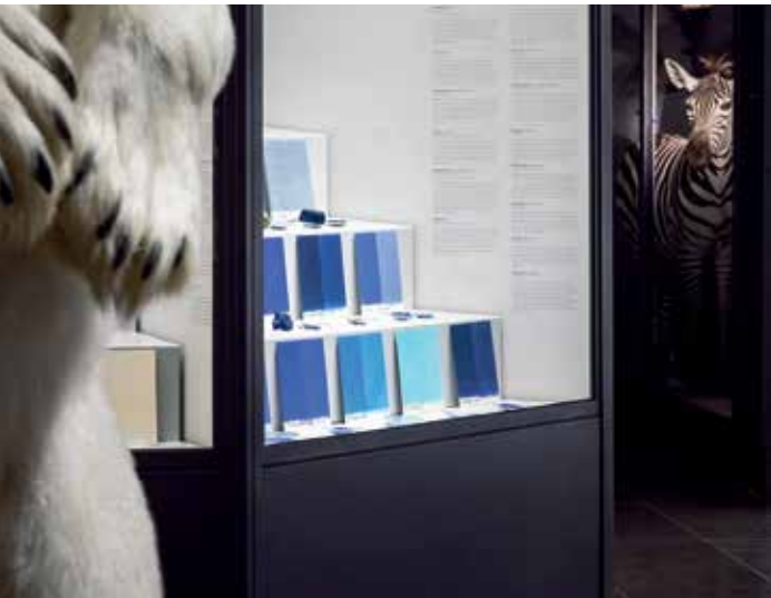
Blau, schwarz und weiß – Beispiele aus der Welt der Farben