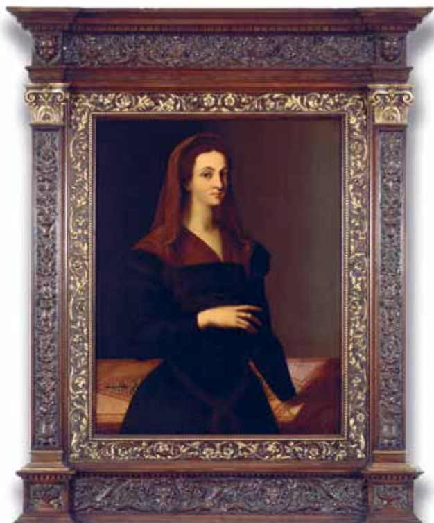
Sebastiano del Piombo, Giulia Gonzaga, 1532

In den Kunstsammlungen erwarten Sie Glanzstücke der modernen und zeitgenössischen Kunst, der klassischen Moderne und der Alten Meister. Das Herzstück bildet die weltweit bedeutendste Sammlung des Werkes Alexej von Jawlenskys, das immer in unterschiedlichen Facetten präsent ist. Vom deutschen Expressionismus bis zur europäischen, russischen und amerikanischen Kunst nach 1950 finden Sie Werke der großen Künstler neben Neu- oder Wiederentdeckungen. Bei Ihrem Rundgang können Sie in unseren Themenräumen zwischen den Zeiten mäandern und so die Plastik des Mittelalters, die italienische Renaissance, den Barock oder das 19. Jahrhundert im Kontext der Gegenwart betrachten.