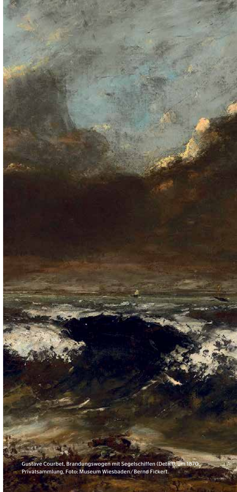
Gustave Courbet, Brandungswogen mit Segelschiffen (Detail), um 1870. Privatsammlung, Foto: Museum Wiesbaden / Bernd Fickert.